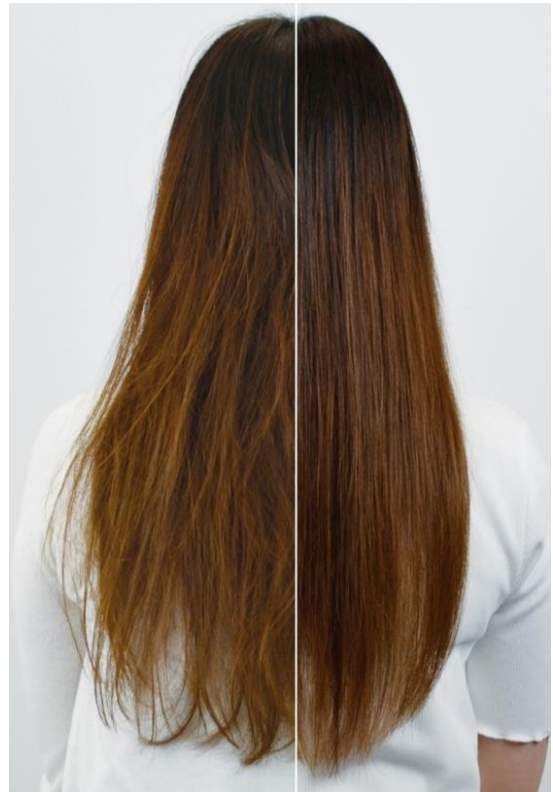
キューティクルを保護し、毛先までまとまりのある髪へ

さらに、2種の「ヒアルロン酸」が髪の毛1本1本をコーティングするので、毛先まで手触りの良い“つるん”とした髪に整えます。