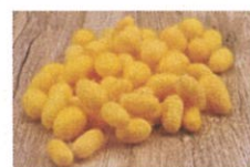
ゴールドンシルク*