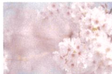
ソメイヨシノ葉エキス*