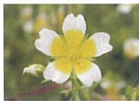
メドウフォーム油*