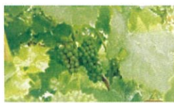
ぶどう果実エキス*