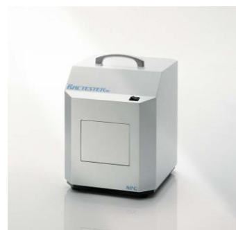
微生物荧光成像测量仪 BACTERESTER