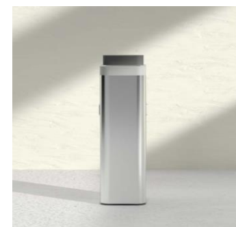
空间杀菌装置 Devirus AC