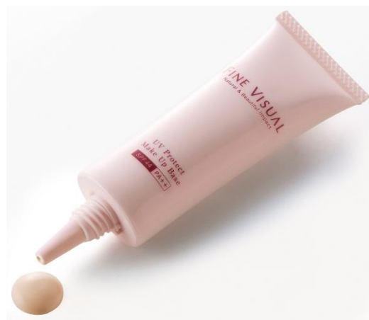
美容成分を贅沢に配合し、 ツヤとハリのある肌に導く化粧下地

カラーは、「オレンジベージュ」1 色展開です。淡く、肌なじみの良い色なので、パーソナルカラーに関係なくお使いいただけます。肌に薄く伸ばすと、自然な血色感を与えるとともに、配合している微粒子パウダーが光を反射して、くすみや色ムラなどの肌悩みをカバーします。ひと塗りで、ナチュラルなツヤ肌を演出します。