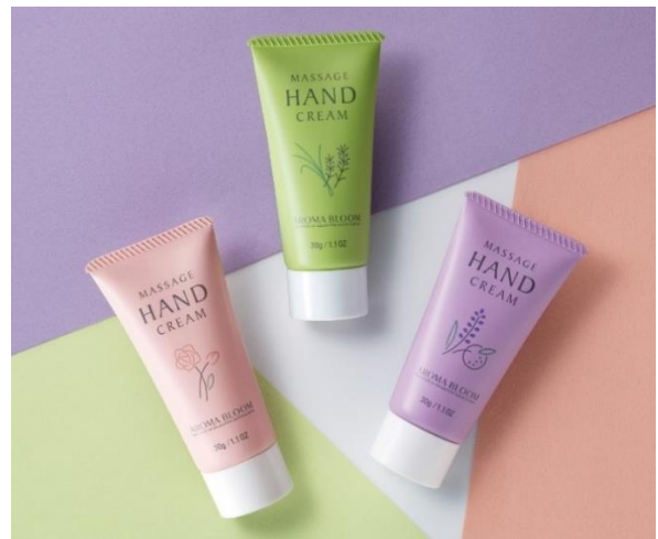
第一弾商品の「ノバラ」(左)、今回新発売する「フレッシュハーブ」(中)、「ラベンダーオレンジ」(右)天然精油の香りに癒されるハンドクリーム全 3 種を展開

今回、新たに発売するのは「マッサージハンドクリーム ラベンダーオレンジの香り」と「同 フレッシュハーブの香り」です。“ラベンダーオレンジの香り”にはラベンダーとオレンジを、“フレッシュハーブの香り”にはレモングラスとローズマリー、ラベンダーを使用しています。気分や使用シーンに合わせて、香りを使い分けするのもオススメです。